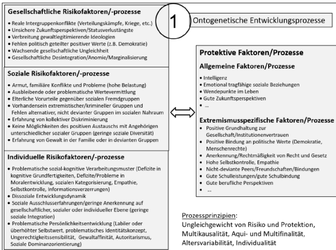
Abbildung 1: Übersicht zu Risiko- und protektiven Faktoren der Radikalisierung (Beelmann et. al. 2021)

Ontogenetische Entwicklungsprozesse weisen keine direkte Kausalität mit Radikalisierung auf, sie können diese jedoch begünstigen oder unwahrscheinlicher machen. Sie beziehen sich auf den Altersbereich zwischen früher Kindheit und 20 Jahren. Es wird zwischen gesellschaftlichen, sozialen und individuellen Risikofaktoren sowie allgemeinen und extremismusspezifischen protektiven Faktoren unterschieden (vgl. Abbildung 1). Sofern ein chronisches Übergewicht von Risikofaktoren besteht, wächst die Gefahr der Person sich politisch oder religiös zu radikalieren. Allerdings ist zu bedenken, dass sich die meisten Menschen trotz vielen Risikofaktoren nicht dem Extremismus zuwenden. Den ontogenetischen Entwicklungsprozessen liegt die Annahme zu Grunde, dass Radikalisierungsprozesse durch biographische Prozesse zu erklären sind.